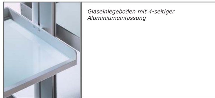
Glaseinlegeboden mit 4-seitiger Aluminiumeinfassung