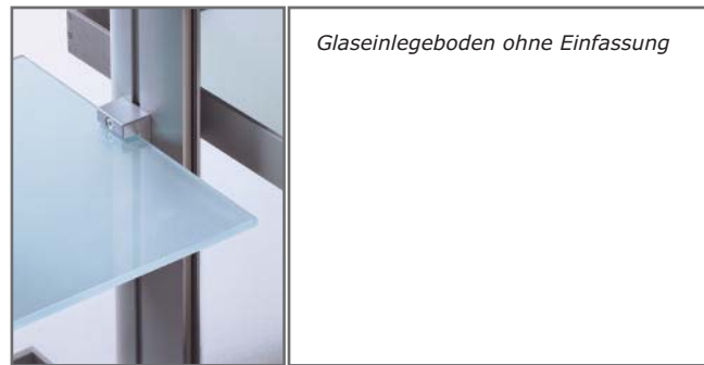
Glaseinlegeboden ohne Einfassung