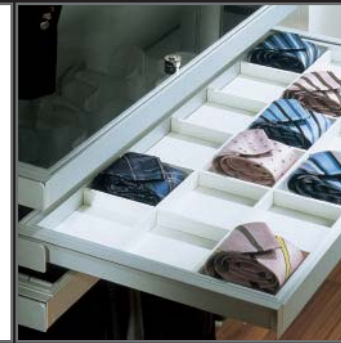
Auszugsboden mit abschließbarem Sammelfach