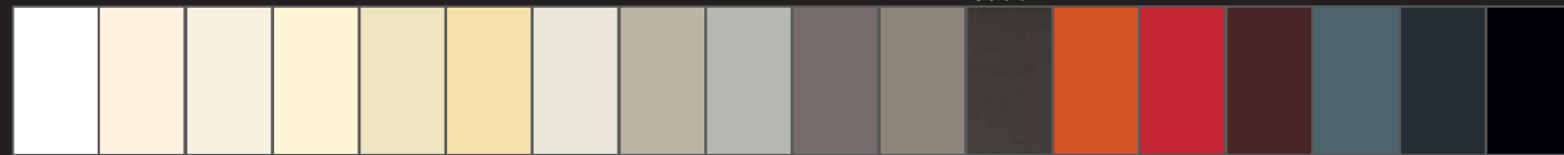
Reinweiß Creme-weiß Noblesse-weiß Cham-paign Perlweiß Vanille Grau-weiß Seiden-grau Silber-grau Platin-grau Sand-braun Nacht-grau Rot-orange Verkehrs-rot Schokola-denbraun Graublau Anthrazit Schwarz

Auf Wunsch erhalten Sie edle Lackoberflächen auch in jedem erdenklichen Wunschfarbton nach RAL, NCS oder Sikkens.