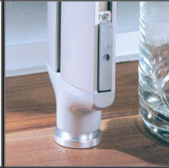
reddot Design Award