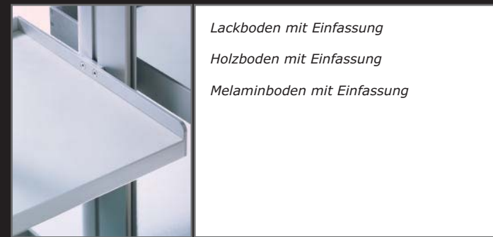
Lackboden mit Einfassung Holzboden mit Einfassung Melaminboden mit Einfassung