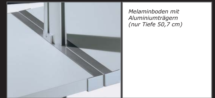
Melaminboden mit Aluminiumträgern (nur Tiefe 50,7 cm)